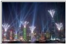
가보고 싶은 세계여행