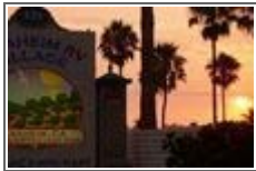
드디어 서부의 끝