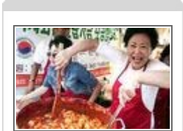
'맛' 좀 보실래요?