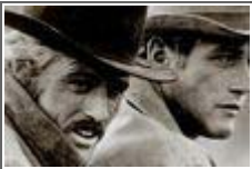
'폴 뉴먼' 별세