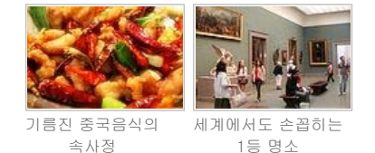
기름진 중국음식의 속사정 세계에서 손꼽히는 1등 명소

변화는 이렇게 오더라 ** 정말 슬픈 이야기 ** 3종류의 여자 언제나 행복할 수 있는 비결 3가지.. 요가... 휴대할 수 있는 권력, 그리고 유대인 (2) 중국 장사 3박4일 물 ~소리 ㅎㅎㅎ^~^ 다시보는 샌다이 지역에 모습 진정 난 몰랐네 그리움의 간격