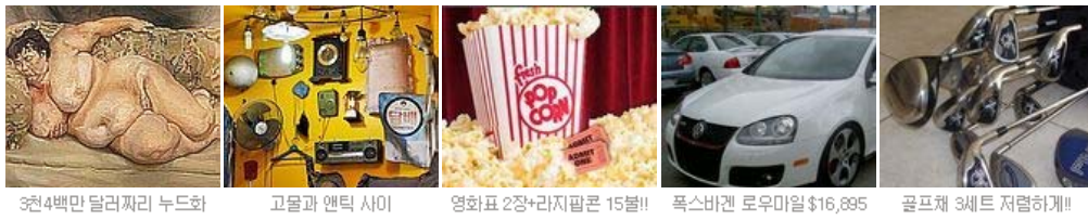
3천4백만 달러짜리 누드화 고물과 엔틱 사이 영화표 2장+라지팝콘 15불!! 폭스바겐 로우마일 $16,895 골프채 3세트 저렴하게!!