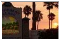
드디어 서부의 끝