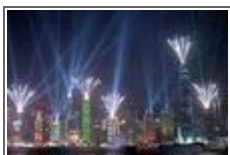
가보고 싶은 세계여행