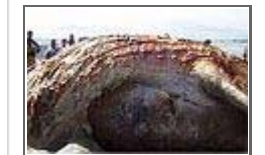
정체불명 '바다 괴물'