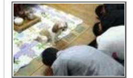
어느 집 제삿날