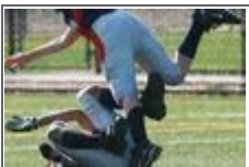
옛 발위치가 위험한데