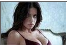
환상 몸매 '리마'