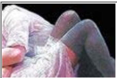
배우들의 반라 정사신