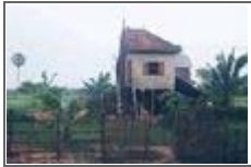
이혼 후 나눠진 집