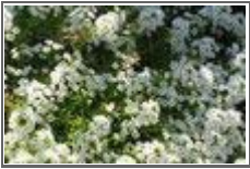
말할 수 없는 비밀