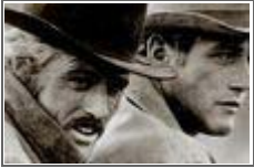
'폴 뉴먼' 별세