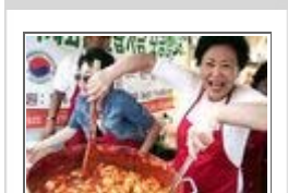
'맛' 좀 보실래요?