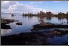
검은 것이 모두 파리떼