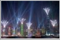
가보고 싶은 세계여행